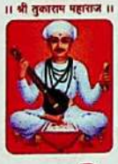
॥ श्री तुकाराम महाराज ॥