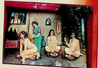
सिद्धबेट, येथे योग सामर्थ्याने श्री संत ज्ञानेश्वरांच्या पाठीवर मुक्ताईने मांडे भाजले

आलेल्या सर्व भाविक भक्तांचे महाराष्ट्र शासनाच्या वतीने सहर्ष स्वागत !