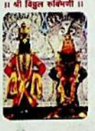
॥ श्री विठ्ठल रुख्मिणी ॥