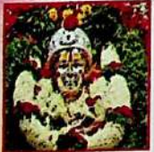
॥ श्री ज्ञानेश्वर महाराज ॥