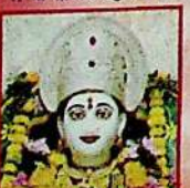
॥ श्री मुक्ताबाई महाराज ॥

सिध्दबेट ग्रामविकास प्रतिष्ठाण व दत्तसेवा प्रतिष्ठाण सिध्दबेट केळगाव व समस्त ग्रामस्थ यांच्या संयुक्त विद्यमाने भाविक भक्तांच्या सेवेर्थ शुक्रवार दि. २३/८/२०१९ ते १२/०७/२०२० पर्यंत अन्नछत्र सुरु केले आहे. येथे दर्शनाकरिता येणाऱ्या भाविकांना दर गुरुवारी, पोर्णिमा व प्रत्येक एकादशीला दु. १२ ते ३ या वेळेत प्रसादाचा लाभ घेण्यासाठी ही सेवा सुरु केली आहे. इच्छुक भक्तांनी अन्नदानाकरीता आपल्या एक दिवसाची अन्नदानाची तारीख (दिवस) निश्चित करण्यासाठी रु.५१००/- श्री सिध्दबेट ग्रामविकास प्रतिष्ठान व दत्त सेवा प्रतिष्ठान यांच्या नावे देणगी संस्थेच्या कार्यालयात जमा करावी व त्याची रितसर पावती घ्यावी. ज्या इच्छुक भाविकांना आपल्या इच्छेप्रमाणे अन्नदानाची देणगी द्यावयाची असेल त्यांनी सदर देणगी प्रतिष्ठान समितीकडे जमा करावी. ज्या अन्नदात्यांना गुप्त देणगी देण्याची इच्छा असेल त्यांनी सदर देणगी चेक/डी.डी./आर.टी.जी.एस. मार्फत प्रतिष्ठान समितीच्या खात्यात जमा करावी. तसेच वस्तू स्वरुपात अन्नदानाची मदत करण्याची इच्छा असल्यास भाविक भक्तांनी सदर वस्तू सिध्दबेट कार्यालय, केळगांव या ठिकाणी जमा कराव्यात.