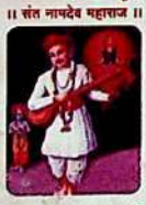
॥ संत नान्देव महाराज ॥