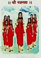
॥ श्री निवर्तन ॥