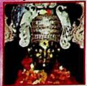
॥ श्री निवृत्तीनाथ महाराज ॥