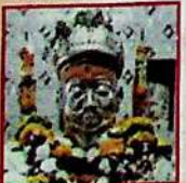
॥ श्री सोपान महाराज ॥